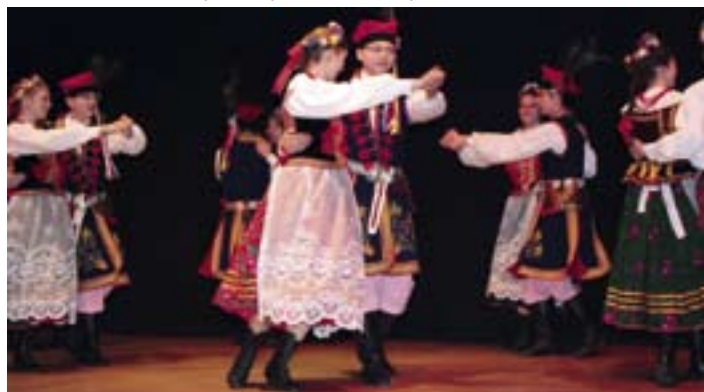
Lazurki na WAT

VIII Festiwal Piosenki Przedszkolnej odbył się w trzech turach, bo widownia BCK nie pomieściłaby wszystkich widzów. Wystąpiło 17. solistów i 19 zespołów, łącznie zaśpiewało 295 dzieci (wszystkie