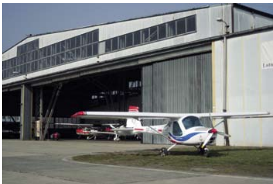
Lotnisko jest siedzibą kilku firm szkolących pilotów