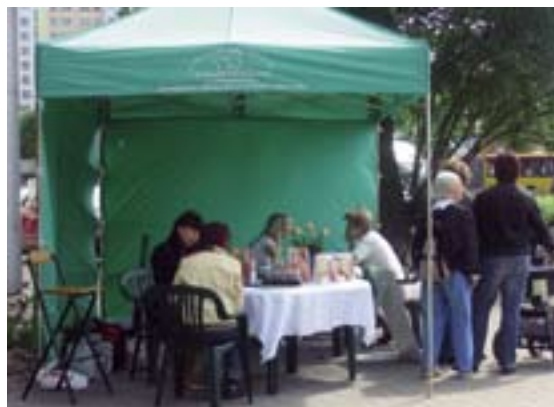
Dzień Matki przed bemowskim ratuszem

W maju Centrum Promocji Zdrowia i Edukacji Ekologicznej wzięło też udział w 8. Wolskiej Majówce „Na Wolę po zdrowie”.