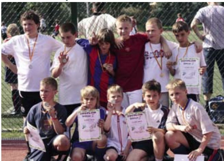
Młodzi piłkarze nagrodzeni w trakcie piknikowego turnieju

Dla dzieci i młodzieży niebiorącej udziału w zawodach przygotowano część rekreacyjną: pokazy gimnastyki sportowej w wykonaniu uczestniczek zajęć organizowanych przez Wydział Sportu oraz pokazy samoobrony w wykonaniu członków Stowarzyszenia