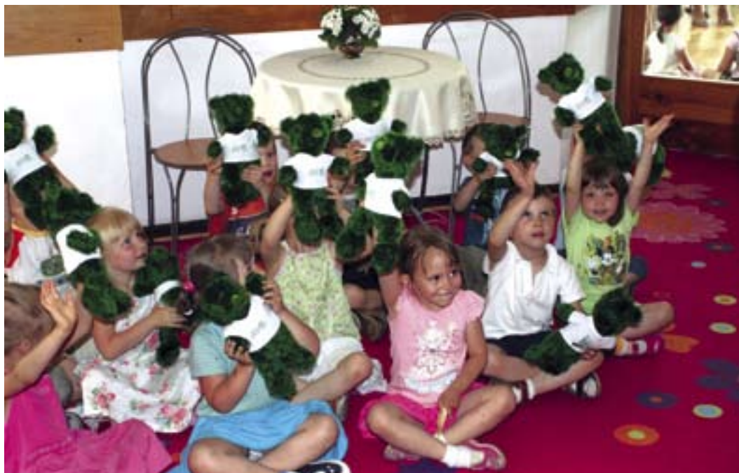
Przedzkolaki z Secemińskiej pokazują swoje nowe pluszaki

Akcja Bemis może się niektórym wydawać niepotrzebna lub co najmniej niezastługująca na tak obszerną relację. Są zapewne poważniejsze i gorętsze tematy niż tourné zielonego misia po bemowskich przedszkolach. Ale pomysł z Bemisiami świadczy, że w Urzędzie Dzielnicy nie myśli się o mieszkańcach tylko w kategorii potencjalny wyborca, jak również, że mówiąc o bemowiakach, ma się na myśli także tych najmniejszych i ich specyficzne po-