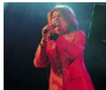
Koncert Krystyny Prońko

Gwiazdą tegorocznych BDK była Krystyna Prońko. Na koncert złożyły się stare i nowe przeboje. Jej nowa płyta „Poranne łyzy i inne tęsknoty” rozeszła się po koncercie w całym dostępnym nakładzie. I to jest najkrótszą recenzją recitalu artystki.