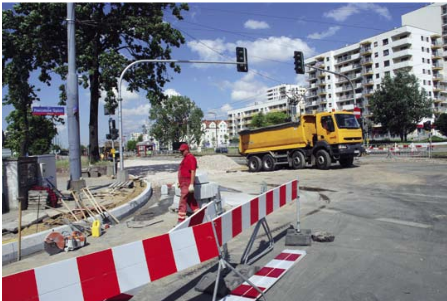
Rozkopana Górczewska - robota wre