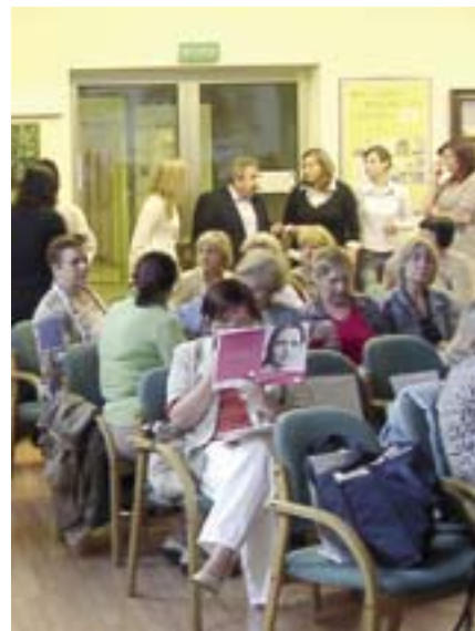
Spotkanie z cyklu „Kobiety dla kobiet”

15 maja w Urzędzie Dzielnicy Bemowo odbyło się spotkanie z cyklu „Kobiety dla Kobiety” dotyczące profilaktyki raka szyjki macicy, zorganizowane przez stowarzyszenie „Kwiat Kobiecości” oraz Wydział Spraw Społecznych i Zdrowia. Spotkanie miało na celu uświadomienie, jak wielkim zagrożeniem jest wywołujący raka szyjki macicy wirus HPV, jak walczyć z chorobą,