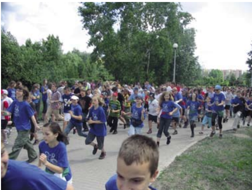
Młodzi uczestnicy biegu po zdrowie