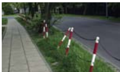
Słupki na Siemiatyckiej

walniające wymagają odpowiedniego oznakowania. Pismo z prośbą o wyjaśnienie tej sprawy zostało wysłane przez Urząd Dzielnicy Bemowo do SM Górczewska. Tego samego dnia poinformowano dyżurującego konsultanta, że przy ul. Konarskiego na wysokości wyjazdu z Urzędu Dzielnicy ustawiony jest znak „STOP”, który zasłaniają gałęzie drzew. Po interwencji pracowników Delegatury Bezpieczeństwa i Zarządzania Kryzysowego gałęzie drzew zasłaniające wskazany znak zostały przycięte.