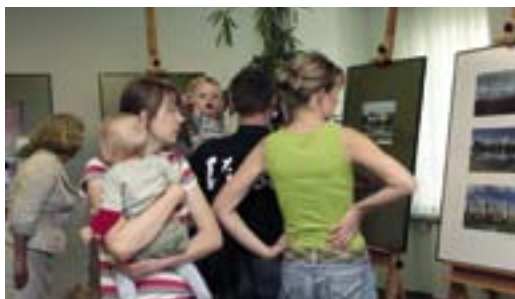
„Bemowo AD 2008” - wystawa pokonkursowa

Tradycyjnie w czasie BDK rozstrzygnięty został konkurs fotograficzny o Bemowie – „Bemowo AD 2008”. Jego celem było zatrzymanie