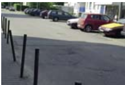
Progi zwalniające na Drogomilskiej

19 maja Urząd Dzielnicy Bemowo został powiadomiony o słabo widocznych progach zwalniających przy ul. Drogomilskiej. Z informacji przekazanych przez mieszkańca Bemowa wynika, że spo-