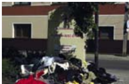
Pojemnik PCK na Pl. Kasztelańskim

26 maja na Bemowski Telefon Interwencyjny wpłynęło zgłoszenie o przepełnionym pojemniku PCK postawionym na pl. Kasztelańskim. Jak udało się ustalić dyżurującemu konsultantowi, inspektorzy Wydziału