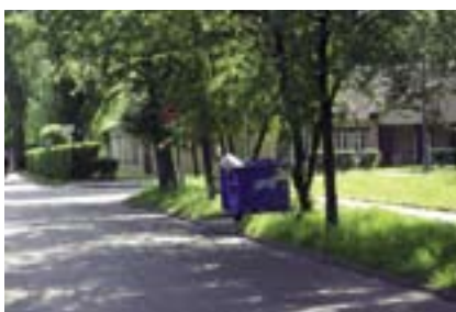
Zasłonięty znak STOP na Konarskiego

28 maja do Urzędu Dzielnicy Bemowo wpłynęły zgłoszenia o nieskoszonej trawie przy ul. Pełczyńskiego i Obrońców Tobruku. Dyżurujący konsultant uzyskał informację od Wydziału