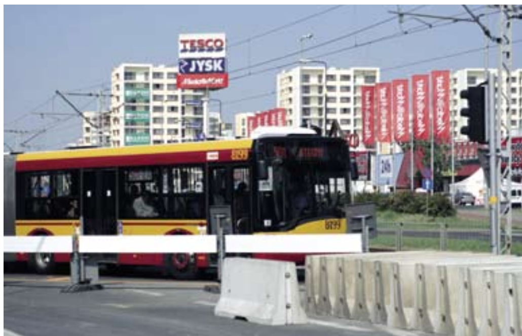
Wąskie gardło przy Tesco na chwilę przed zlikwidowaniem

jaka jest sytuacja. Ponieważ nie udało się skończyć robót w sezonie, na wiadukt przyszło jeszcze poczekać. Gazety pisały: W robotach nie przeszkodziła zima, ale kłótnia wykonawcy z Zarządem Dróg Miejskich. MPRD twierdzi, że nie buduje jezdni, bo ZDM nie płaci. Zarząd Dróg Miejskich jest im winny 3,2 mln zł za wykonanie dodatkowych prac przy budowie jezdni Górczewskiej, którą warszawiacy jeżdżą teraz. ZDM nie zatwierdził też planów wjazdu z ulicy Górczewskiej na teren ratusza urzędu dzielnicy Bemowo, który znajduje się przy skrzyżowaniu z Powstańców Śląskich. Zarząd Dróg Miejskich oczywiście wszyst-