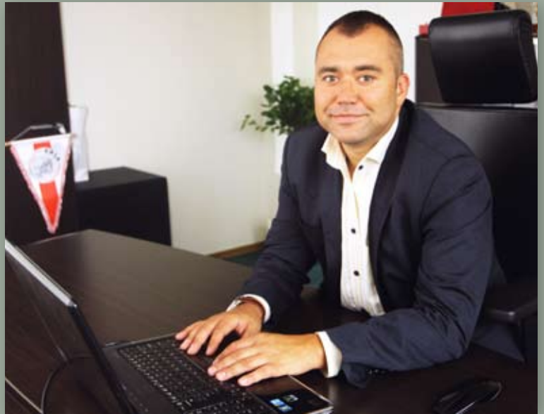
Burmistrz Jarosław Dąbrowski odpowie na każde pytanie

„Zadaj pytanie burmistrzowi” to specjalny formularz zamieszczony na stronie internetowej www.bemowo.waw.pl . Wystarczy podać swój e-mail (można oczywiście też imię i nazwisko) i wpisać swoje pytanie w okienku na stronie. Odpowiedzi wysyłane są e-mailem. Oczywiście do burmistrza można pisać też zwykłe listy lub e-maile na adres burmistrz@bemowo.waw.pl .