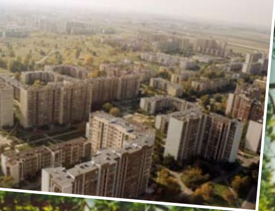
Osiedle i park Górczewska