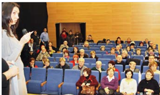
Losowanie było jawne, pod baczным okiem obserwatorów

Po zebraniu wszystkich zgłoszeń zostało przeprowadzone jawne losowanie. W Art.Bemie