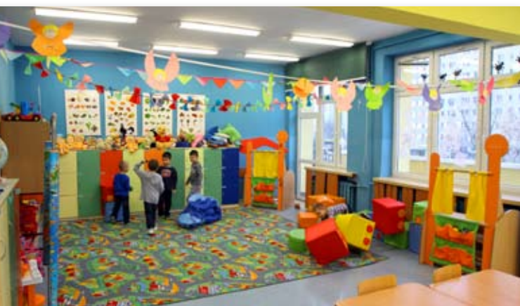
Kolorowe, przyjazne sale, miejsce do zabawy i nauki – zerówki w szkołach nie różnią się od tych w przedszkolach