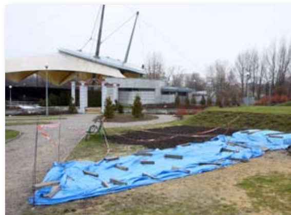
W tym miejscu stanie popiersie węgierskiego poety

W 1849 r. otrzymał od Kossutha aprobatę na przydział do armii siedmiogrodzkiej, dowodzonej przez gen.