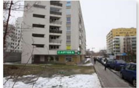
Zaniedbany skwer przy zakręcie w ul. Pelczyńskiego