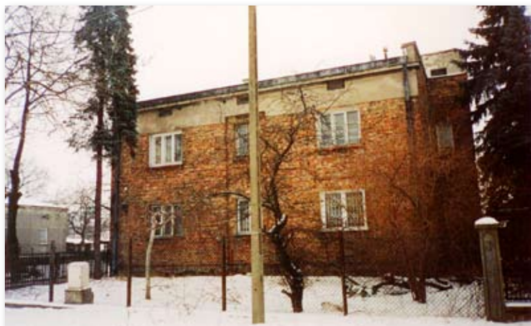
Kamienica przy ulicy Żeńców 9 została rozebrana w 2007 roku.