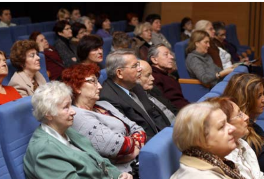
Na spotkanie z w Art.Bemie przyszło kilkadziesiąt osób