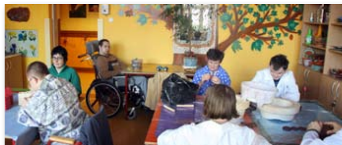
Zajęcia w Ośrodku Wsparcia i Rehabilitacji przy ul. Rozłogi

– Przebywają u nas dorośli, którzy mają rodziców w podeszłym wieku. Dzięki temu,