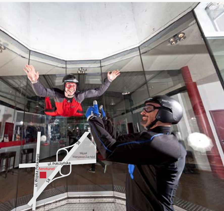
W takim tunelu powietrznym można poczuć się jak podczas skoku ze spadochronem.