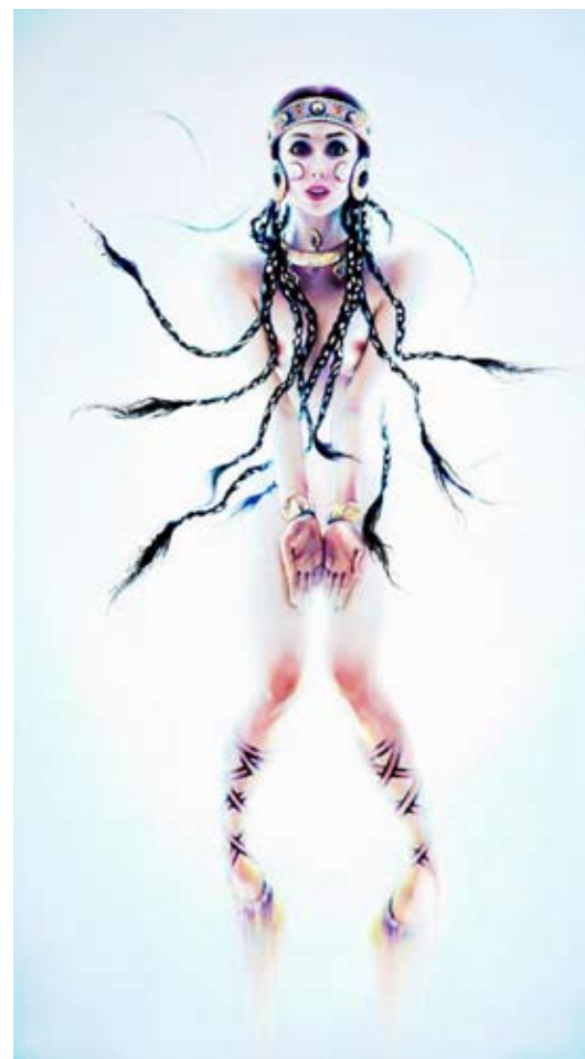
„Wybrana”, obraz Róży Puzynowskiej