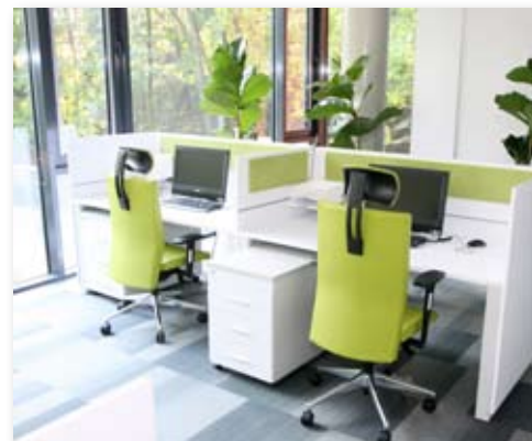
Centrum Przedsiębiorczości Smolna