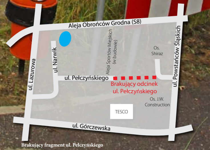
Brakujący fragment ul. Pełczyńskiego