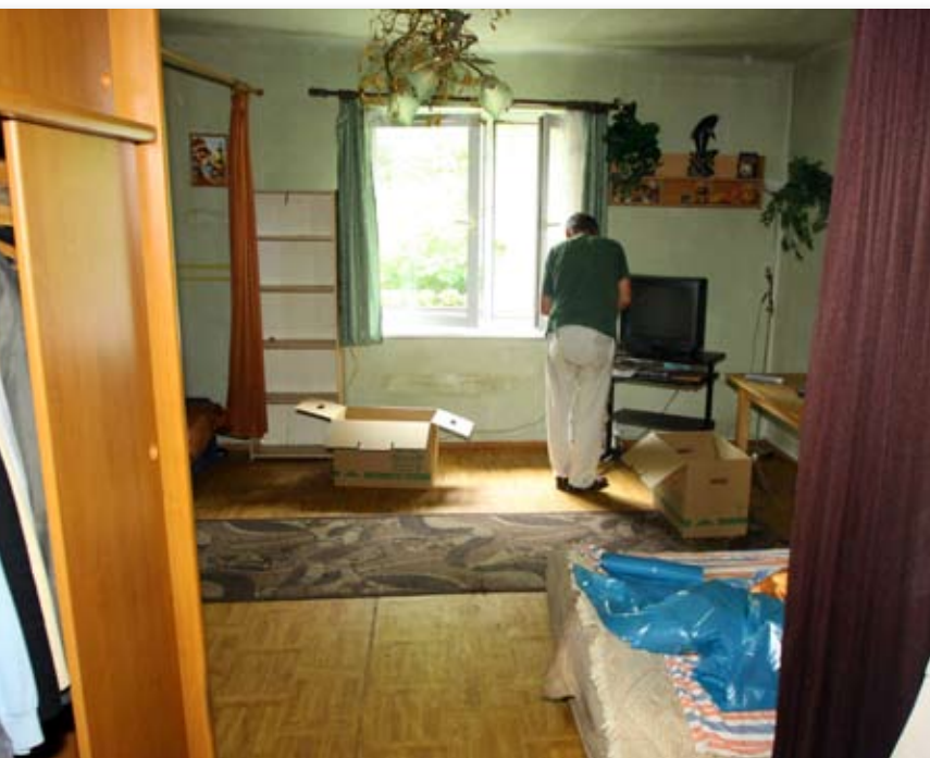
Przykładowe mieszkanie socjalne